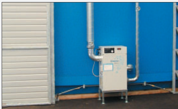
PMH Torrluftlager är som standard utrustad med avfuktare.